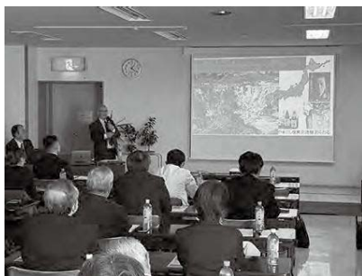
田中ZCからのLCIF支援説明