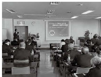
今野会長による避難所の課題説明