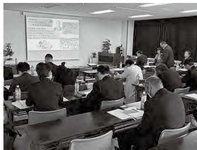
早坂委員長地区内に於ける備蓄状況