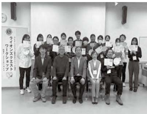
全体での受講者との集合写真

教職員の皆様からは、今後は教育の場で受講した内容を活用していくとの報告を受け、活発な受講で1日のワークショップを終了することが出来ました。