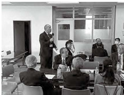
社会福祉協議会から挨拶