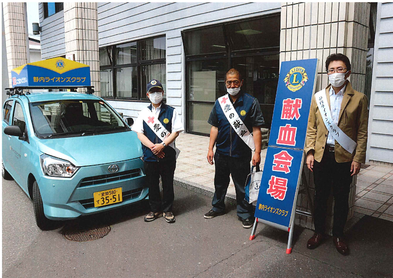
静内ライオンズクラブ