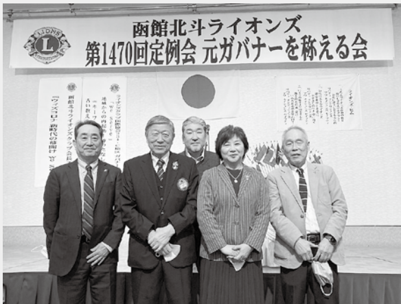
函館北斗LC仲間と記念撮影

我がライオンズ人生が突然変わってしまった出来事。2012年に第二副地区ガバナーを、我が北斗ライオンズクラブから誰かを人選しなければならない『大事件』勃発。あの時自分には、ガバナーの選択肢は100%なかった。せいぜい例会に出るのが関の山と言う、当時は控えめな会員だった。