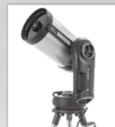
■天体望遠鏡 NexStar Evolution8