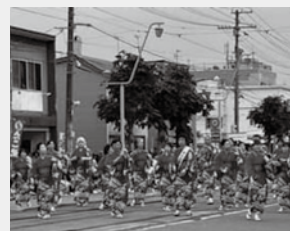
ワッショイ函館 (金髪の女性がビルマ)