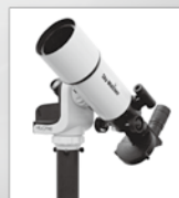
■太陽望遠鏡 ソーラークエスト804