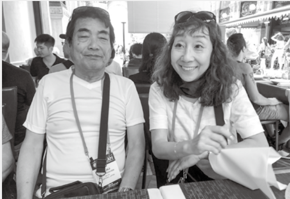
イタリアミラノで妻と撮影

尾も白い犬。尾も白くない犬。尾も白くないから尾が黒い犬（ひと昔前流行ったダジャレ）人によって「面白い話でも」半分の確率で、「面白くない」と感ずる人がいるのも世の常です。「面白くない」と感じた人ならば、「面白い話し」を書けばいいんでないかい。