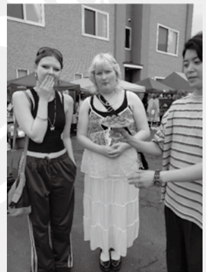
グリーンLCメンバーのマルシェで美味しいミニトマトのおもてなし