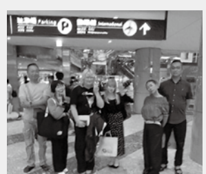
南千歳空港 (ビルマの見送り)