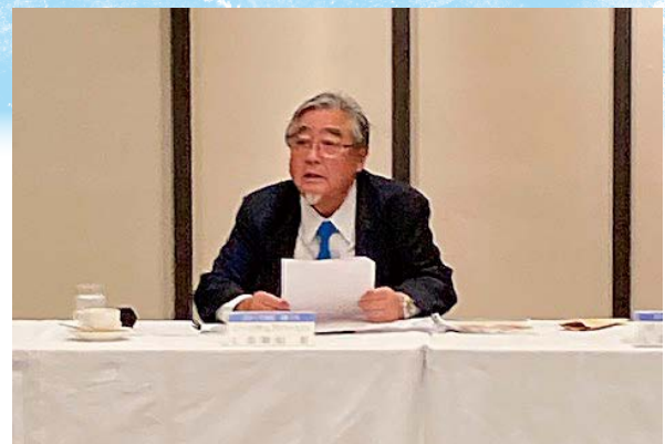
ガバナー諮問委員会議長のL志賀松ZC

在クラブ』。主役はあくまでも、クラブメンバーだ。クラブのリーダーである会長と幹事に、出来るだけ負担をかけずに、ガバナー方針を理解してもらえれば、良好な結果出るのは間違いないはずだ。(L志賀松ZCの談話)