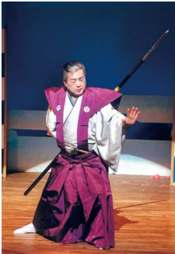
見事な立ち居振る舞い