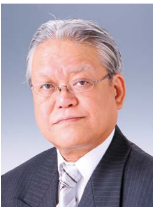
第二副地区ガバナー 長期計画リサーチ副委員長