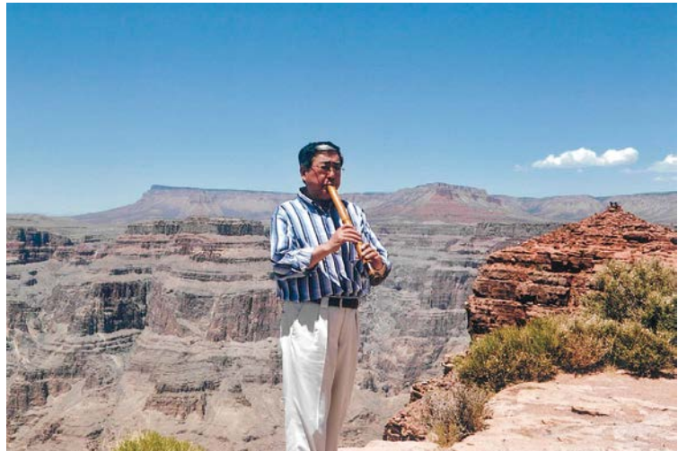
瞑想にふける虚無僧ライオン