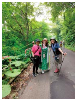
ノルディックウォーキング全国大会 in HAKODATE

子供からお年寄りまで楽しめ、今や世界の70カ国で詠まれています。俳句をユネスコ無形文化遺産登録推進協議会によると、国民の盛り上がりが大切な