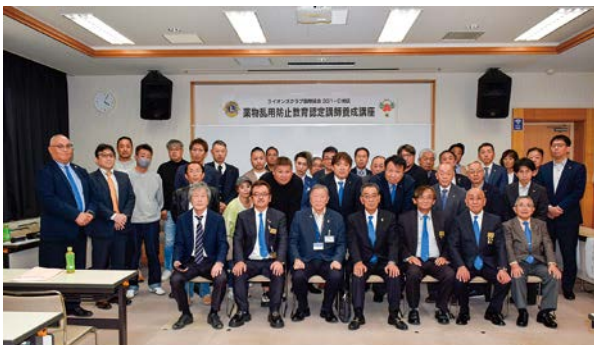
参加者の記念撮影

薬物乱用問題は依然として全世界的な問題となっております。日本においても最近、大麻の検挙者数が、過去最大を更新し、覚醒剤検挙者数を上回り、10~20代の若年層が7割を占めています。さらに10代の若者の間で市販薬の過剰摂取という、新たな問題も指摘されております。