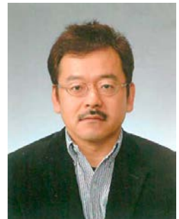
YCE委員会・薬物乱用防止委員会委員長

青少年に薬物乱用の危険性を伝え、健康を守る大切さを教えることで、薬物乱用防止の水際対策ですが、ライオンズクラブの大きな役割です。薬物乱用は「ダメ。ゼッタイ。」です。(了)