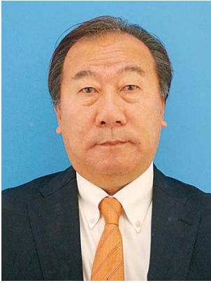
第一副地区ガバナー 長期計画リサーチ副委員長