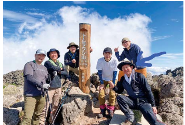
山登り仲間と記念撮影

我々は小樽市、倶知安町、ニセコ町で活動しているクラブでありそれぞれの地域の特徴を活かし様々なクラブ活動を行っています。