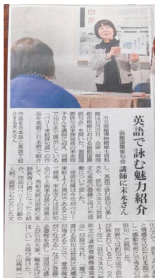
「開港都市函館における函館国際俳句会」講演 2024.11.1 新聞記事