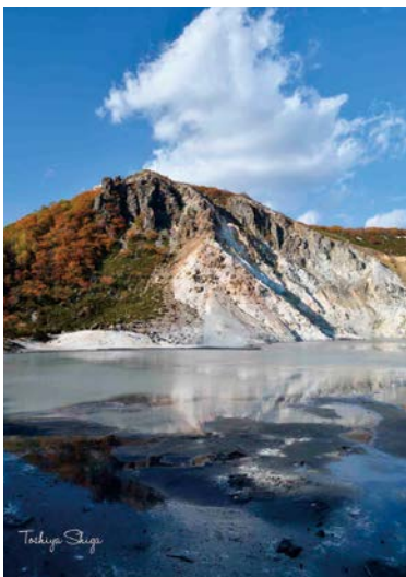
登別温泉「大湯沼・日和山」