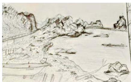
散策中のスケッチ